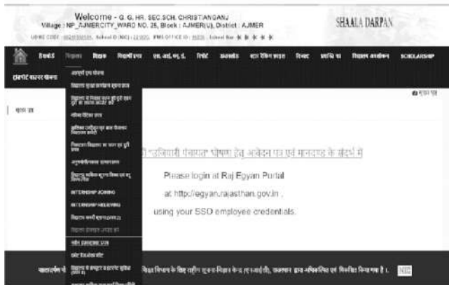
चित्र संख्या 1.1

4. इसमें मुख्य बिन्दु यह है कि सत्र 2016-17 में कक्षा-9 हेतु वोकेशनल विषयों का चयन उक्त प्रक्रिया से किया गया है तो उन्हीं विद्यार्थियों के लिए सत्र 2017-18 में कक्षा-10 में पुनः प्रपत्र 7A में जाकर अगर कोई विद्यार्थी वोकेशनल ट्रेड ड्रॉप करना चाहे तो उसके लिए none सेलेक्ट कर सेव करें अन्यथा Submit all students subject करना होगा तो ही वे विद्यार्थी सत्र 2017-18 के वोकेशनल स्कूल की नामांकन रिपोर्ट में दिखाई देंगे। आगामी सत्रों में भी सभी कक्षाओं के लिए यही प्रक्रिया अपनाई जानी है।