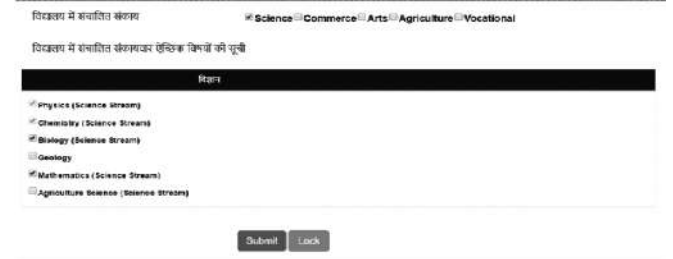
चित्र संख्या 1.3