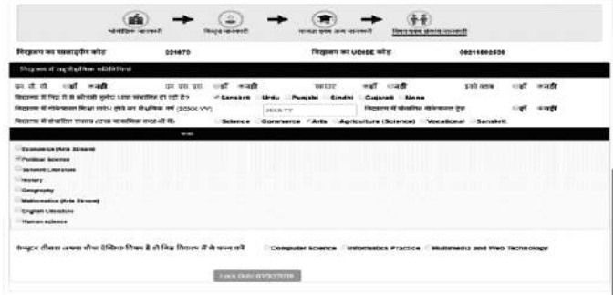
चित्र संख्या 1.2