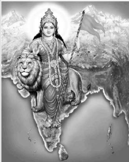
साभार : 'राष्ट्रवंदना' पुस्तक से

हम करें राष्ट्र-आराधन तन से, मन से, धन से, तन, मन, धन, जीवन से, हम करें राष्ट्र-आराधन। अन्तर से, मुख से, कृति से, निश्छल हो, निर्मल मति से श्रद्धा से, मस्तक नति से, हम करें राष्ट्र अभिवादन।।1।। अपने हँसते शैशव से, अपने खिलते यौवन से, प्रौढ़तापूर्ण जीवन से, हम करें राष्ट्र का अर्चन।।2।। अपने अतीत को पढ़कर अपना इतिहास उलटकर अपना भवितव्य समझकर, हम करें राष्ट्र का चिन्तन।।3।। हैं याद हमें युग-युग की, जलती अनेक घटनाएँ, जो माँ की सेवा पथ पर, आयीं बनकर विपदाएँ।।4।। हमने अभिषेक किया था, जननी का अरि-शोणित से, हमने शृंगार किया था माता का अरि-मुण्डों से।।5।। हमने ही उसे दिया था, सांस्कृतिक उच्च सिंहासन, माँ जिस पर बैठी सुख से, करती थी जग का शासन।।6।। अब काल-चक्र की गति से वह टूट गया सिंहासन, अपना तन-मन-धन देकर, हम करें पुनः संस्थापन।।7।।