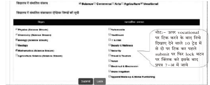
चित्र संख्या 1.4